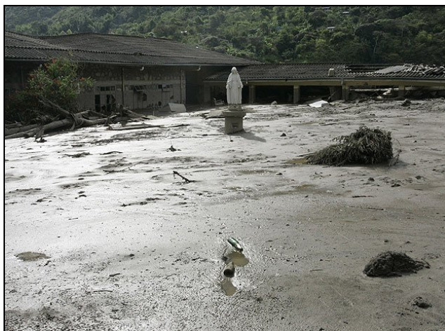
Imagen de la Virgen Milagrosa que resistió el fuerte embate de la avalancha en las instalaciones de la Normal

No obstante las múltiples tragedias que han azotado a los belalcázunos en los últimos días, el ánimo no decae y la consigna es unánime: ¡vamos pa´ lante!